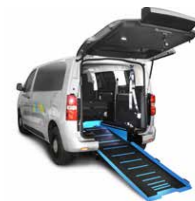
Individual disabled vehicle Transport individuel pour personnes à mobilité réduite