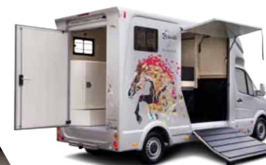
Vans horses Vans à chevaux

Gruau transforme aujourd'hui plus de 50 000 véhicules par an pour les entreprises partout dans le monde. Grâce à sa connaissance de ses clients, Gruau est en mesure de répondre aux attentes spécifiques de ces derniers sur des produits et marques variés en un minimum de temps. La politique de Gruau privilégie l'intégration de nombreux métiers et fonctions sur des sites sécurisés, qui permettent de stocker et de protéger les flottes de véhicules. Grâce à cette organisation, Gruau est en mesure de mobiliser plusieurs de ses 18 sites et ainsi être plus réactif. On peut noter dans le portefeuille clients de Gruau les constructeurs automobile, mais aussi les clients finaux ayant de grandes flottes, les sociétés de leasing, les loueurs techniques et les captives des grands constructeurs.