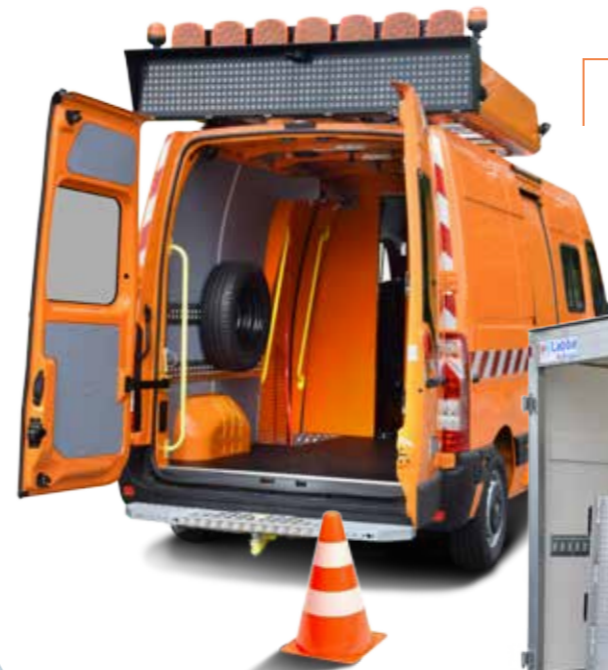
Roads maintenance Entretien des routes

Customized for each need Du sur mesure pour chaque besoin