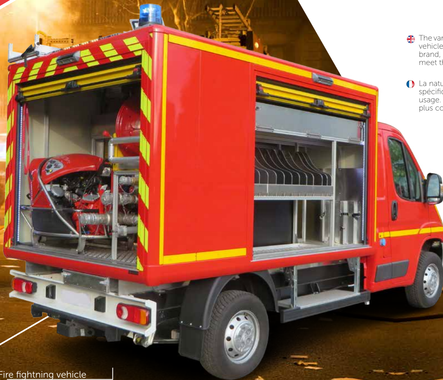
Fire fighting vehicle Les véhicules intervention feu

🇫🇷 La nature variée des interventions pompiers nécessite une multitude de véhicules aux caractéristiques bien spécifiques : véhicules de secours et d'assurances aux victimes, véhicules légers médicalisés, véhicules tout usage. La gamme Gruau, à la fois diversifiée et spécialisée, modulaire et à la norme, représente la solution la plus complète pour répondre aux exigences de tous types d'interventions.