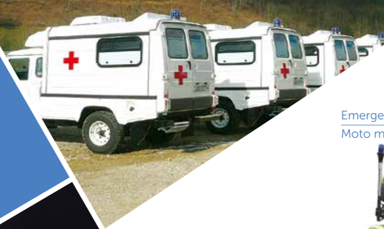
Emergency motorbike Moto médicale d'intervention

Being by your side everyday A vos côtés au quotidien