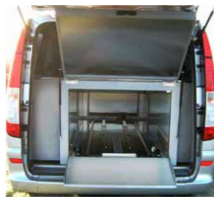
Refrigerated box Caisson réfrigéré