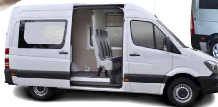
Crew cab Cabines approfondies

Your partner in travel Transport de personnes