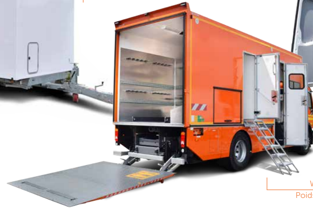
Wellface vehicle Poids lourd enrobés