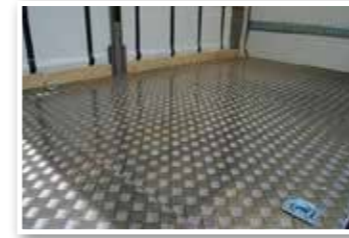
Flatbed tarb dropside Les plateaux banchés