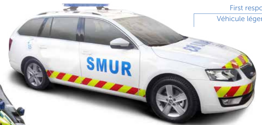
First response vehicle Véhicule léger médicalisé