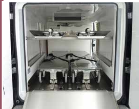
4 bodies transportation Transport 4 corps