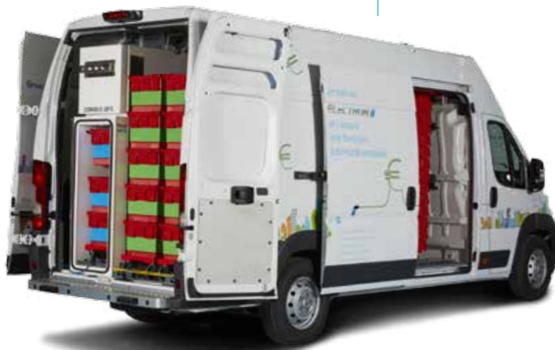
Home Delivery Solution Solution du dernier kilomètre