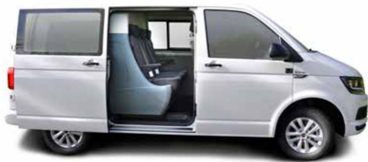
Fixed crew cabs Bennes