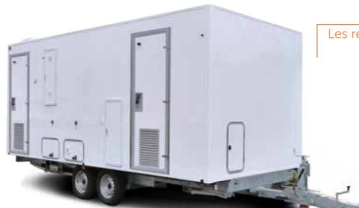
Trailer asbestos removal Les remorques de désamiantage

For all professionals Pour tous les professionnels