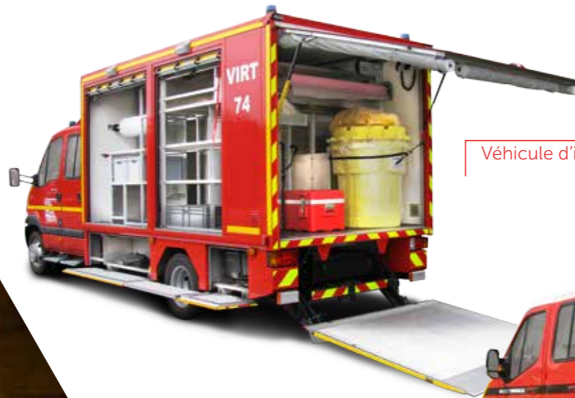
Chemical intervention Véhicule d'intervention risques techniques