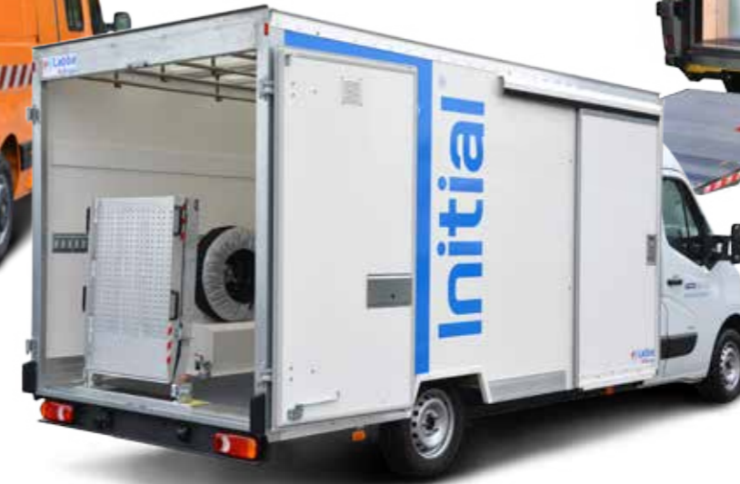
Laundry transport vehicle Véhicule transport de linge