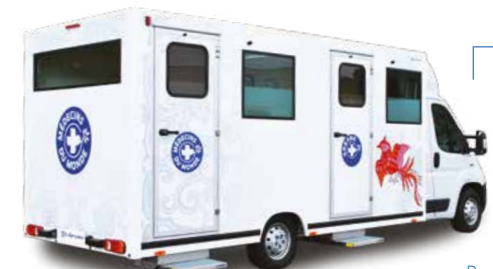
Pediatric Véhicule pédiatrique