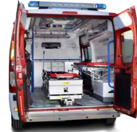
Cynotechnical vehicle Véhicule cynotechnique

🇬🇧 The varied nature of firefighting requires a wide-range of vehicles with very specific characteristics: emergency vehicles to provide assistance to victims, light medicalized vehicles, and multipurpose vehicles. The Gruau brand, both diversified and specialized, modular and standard, offers the most accomplished solution to meet the needs of all types of interventions.