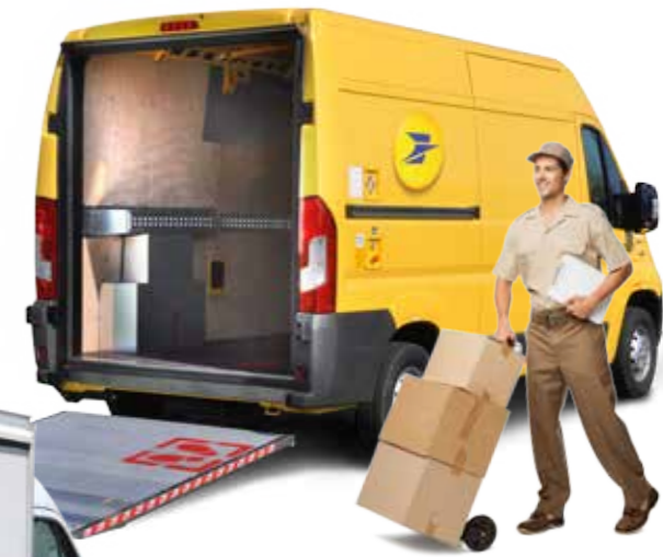
Mail delivery vehicle Véhicule de distribution postale