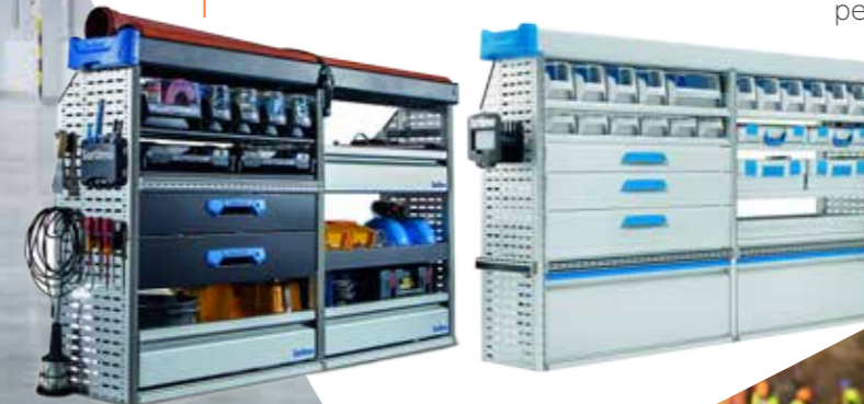
Sortimo metallic layout Les aménagements métalliques Sortimo

🇫🇷 La gamme de transformations BTP développée par Gruau, apporte des commodités aux clients sur les chantiers. Les berces et remorques (non motorisées) sont équipées de cuisine, de salle à manger, de vestiaires et de sanitaires. Les véhicules motorisés type pockets et enrobés ont, quant à eux, la particularité d'apporter en plus des équipements standards (cuisine, salle à manger, vestiaires et sanitaires) le transport de personnes grâce à des sièges homologués.