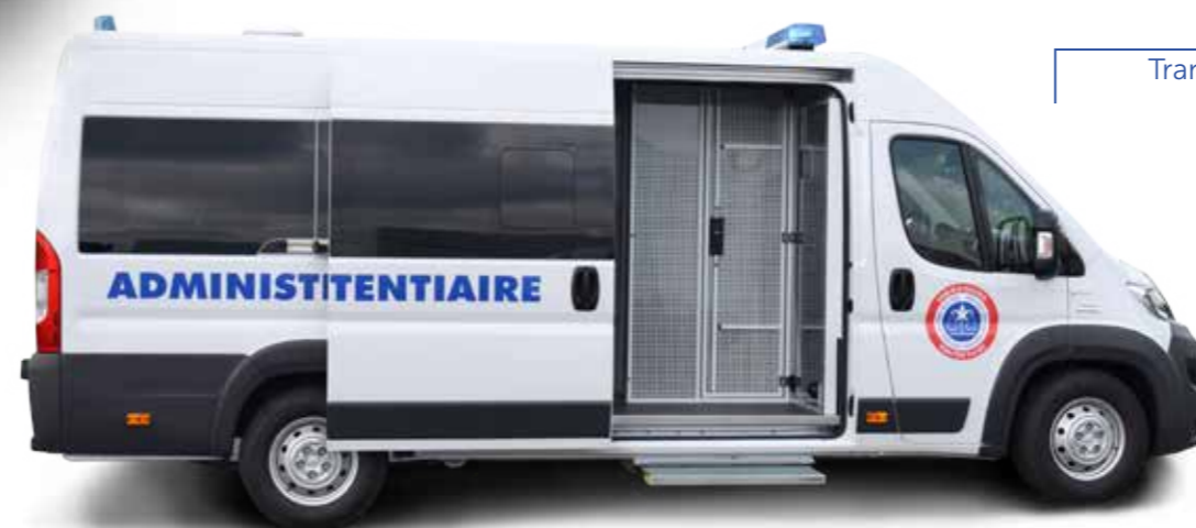
Prisoners transport Transport de prisonniers

Acteur principal du marché Sécurité, GRUAU, avec plus de 6000 unités réalisées, s'impose comme le spécialiste incontestable de la transformation des véhicules pour les marchés Sécurité. Son savoir-faire plus que centenaire, son caractère multi-spécialiste, l'intégration des activités en amont de la transformation, sa capacité industrielle à réaliser des flottes dans des délais courts sont les atouts déterminants pour la réussite de ces marchés et le maintien de la confiance des donneurs d'ordre.