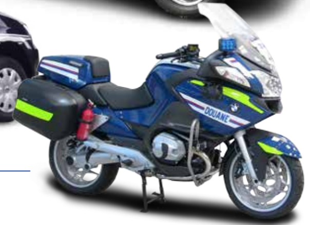
Customs motorcycles Motos de douanes

With its experience in the security sector, Gruau has been able to develop a wide range of law enforcement vehicles for Police services and Customs, including patrol vehicles, intervention vehicles, troops transport vehicles and prisoner transportation vehicles.