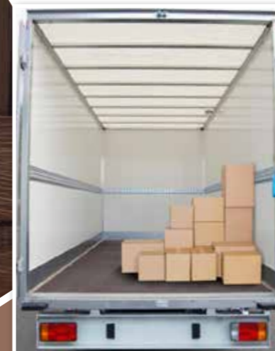
Box vans Les fourgons grand volume

🇫🇷 Le transport de marchandise requiert un outil de travail performant en termes de volume et de charge utile. Pour couvrir ces besoins, Gruau a pensé à deux gammes de produits : - Les fourgons grand volume, des transformations solides grâce à leur pavillon riveté-collé et leur sol monobloc (en bois ou en composite), offrent une importante charge utile, disponible de 17 à 22 m 3 , et personnalisable en fonction de l'usage (Messagerie, déménageur, Mixte). - Les plateaux banchés, légers et robustes grâce à leurs profilés en aluminium assurent une importante capacité de chargement.