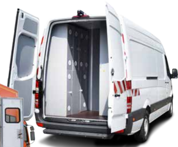
Supply vehicles Les véhicules ravitailleurs