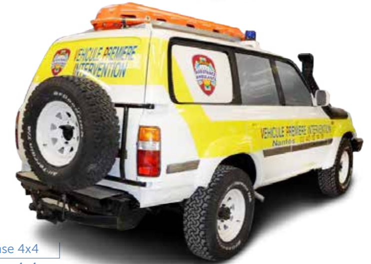
Four wheeldrive first response 4x4 Véhicule rapide d'intervention 4x4

🇬🇧 Gruau's Technical Department is able to customize designs for vehicle-specific missions or emergency services. Whether it is a pediatric or a bariatric ambulance, a mobile clinic or fast response vehicle, Gruau offers multiple solutions for each unique customer need. Gruau has designed a mobile clinic dedicated to local care and personal consultations, blood transfusions, and medical assistance.