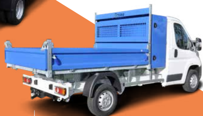
A wide range of tippers Une large gamme de bennes