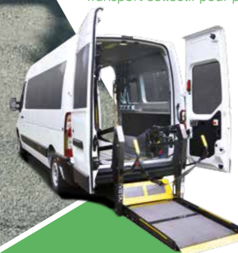
Collective disabled vehicle Transport collectif pour personnes à mobilité réduite

🇫🇷 La problématique rencontrée par les personnes handicapées ou par les sociétés de transport pour les personnes en situation de handicap repose sur le fait de trouver une solution de mobilité en accord avec des besoins ergonomiques : « La transformation est-elle adaptée à mon fauteuil ? », des besoins de confort : « La suspension du véhicule est-elle confortable ? », « A-t-on de la visibilité à bord ? », « Le véhicule est-il silencieux ? », enfin des besoins d'adaptation : « La transformation sera-t-elle adaptée à mon handicap ? ». Fort de son expérience dans le secteur, Gruau a développé son service de conseil, pour répondre efficacement à ses clients sur toutes ses questions. Un Bureau d'Etudes et un service homologation en interne assurent la conformité des véhicules de transport individuel ou collectif aux dernières normes de sécurité, mais aussi une conception innovante pensée en accord avec les besoins spécifiques de ses clients.