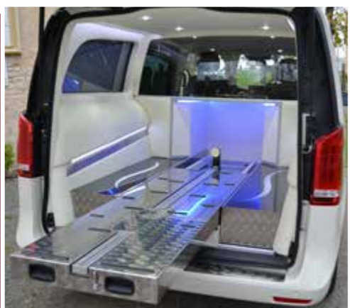
Limousine interior Intérieur limousine

La personnalisation est un élément clé des transformations Gruau. Aussi, est-il possible d'y ajouter une décoration extérieure, des rangements spéciaux ou un intérieur personnalisé.