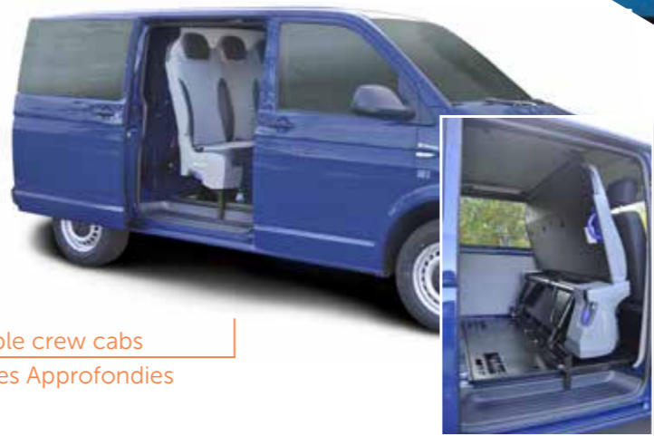
Foldable crew cabs Cabines Approfondies